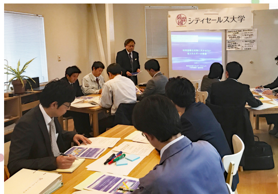
<次世代エネルギー学科の講座風景>

「薩摩國」シティセールス大学は薩摩川内市の地域資源を内外に売り込み、地域振興・産業振興に寄与するための人材育成を行っています。そんな「薩摩國」シティセールス大学の学生の皆さんを、地域をあげて応援するために、割引などのサービスをご提供いただける地域のお店や事業所を募集しています。