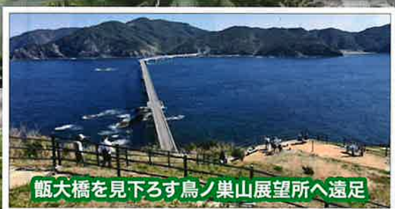
甌大橋を見下ろす鳥ノ巣山展望所へ遠足