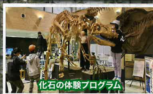
化石の体験プログラム