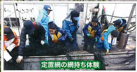
定置網の網持ち体験