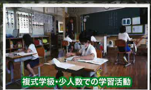
複式学級・少人数での学習活動

実親の負担は月額3万5千円の予定です。（里親への委託料は月額7万円で、そのうち市が月額3万5千円補助します。） また、家族・孫戻し留学については、市が月額3万5千円補助します。 給食費・教材費・学用品などの経費は、実親の負担となります。