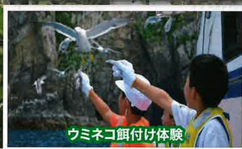
ウミネコ餌付け体験