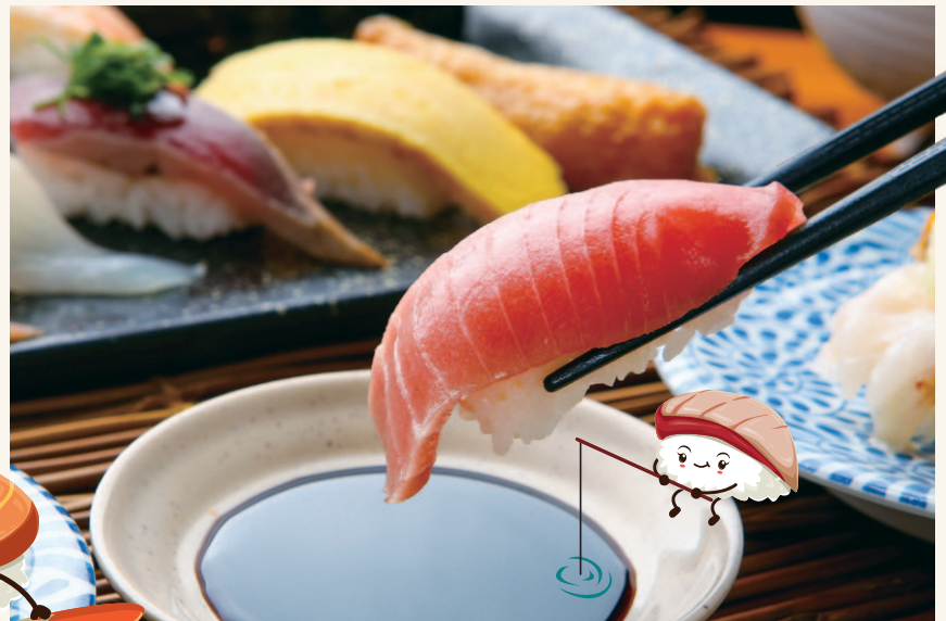
※料理の写真はイメージです。

この夏のゆったり館のイチオシイベントは、 さまざまなお寿司をお腹いっぱい楽しめる 「寿司バイキングフェア」です!