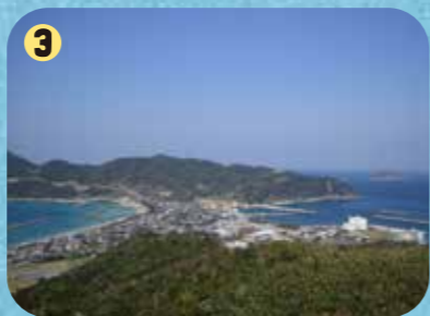
3 トンボロビュースポット