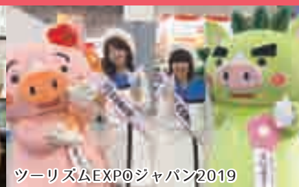
ツーリズムEXPOジャパン2019