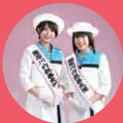
第7代薩摩川内親善大使