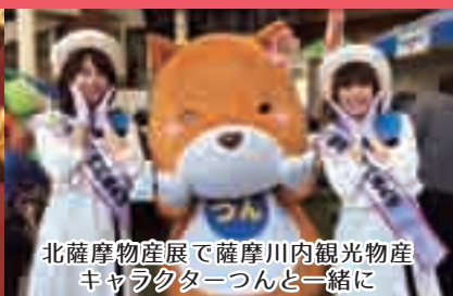
北薩摩物産展で薩摩川内観光物産キャラクターつんと一緒に