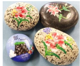
体験例 「玉石アート体験」