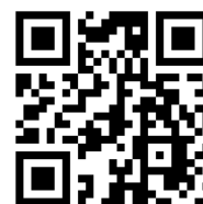
▲ Payどん 操作マニュアル