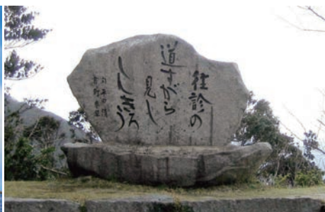
しんきろうの丘石碑