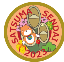
2023年度 ピンバッジデザイン