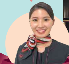
鹿児島県 JAL ふるさとアンバサダー