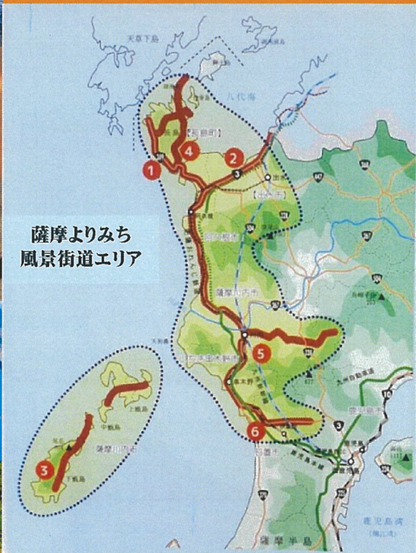
薩摩よりみち 風景街道エリア